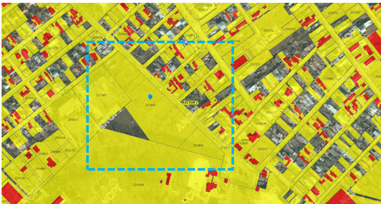
Extras din încadrare ANCPI, Imobile eTerra