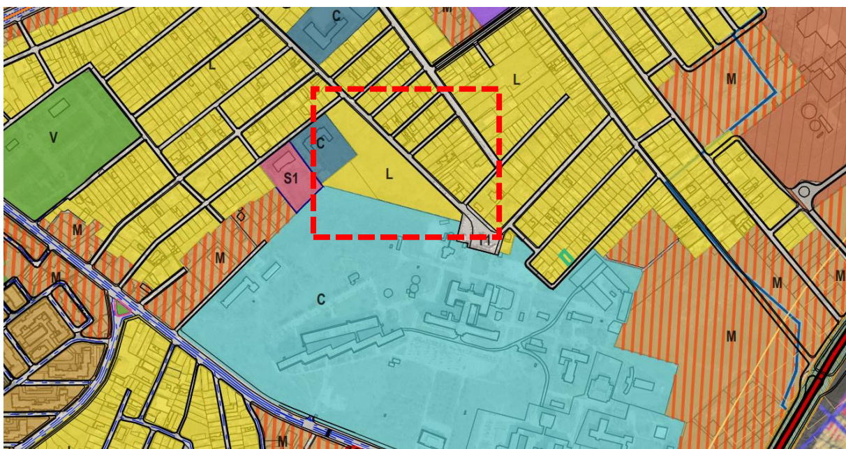
Extras din PUZ Sector 2, aflat în faza Informarea Populației, Etapa Elaborarea Propunerilor

Terenurile cu nr cadastral 235463 și 235464 sunt încadrate în UTR L1e - locuințe individuale pe loturi subdimensionate cu / sau fără rețele edilitare conform PUZ Sector 2, aprobat prin HCL nr 99/2003, în prezent expirat.